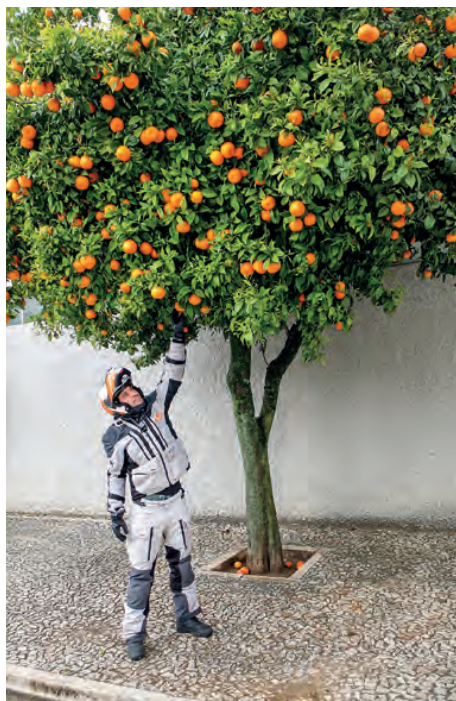
#1 Au Portugal, on peut faire le plein de vitamine C en pleine rue ! #2 Evora, capitale de l'Alentejo, est une ancienne place forte des Romains, comme en témoigne son impressionnant aqueduc.